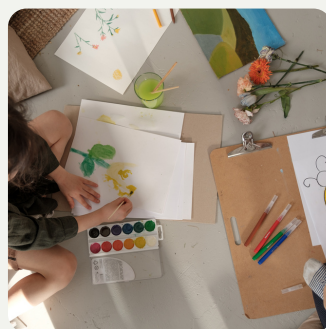
Centre de loisirs Atelier créatif