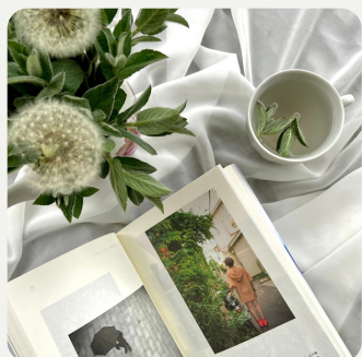
Libraires & Bibliothèque Vente & Lecture