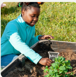
Animation & Prévention Jardin familiaux & Syded