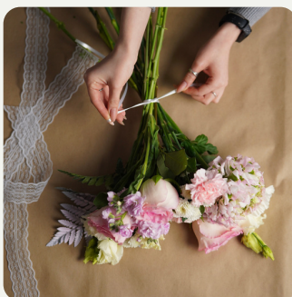
Artisan Fleuriste Atelier de composition