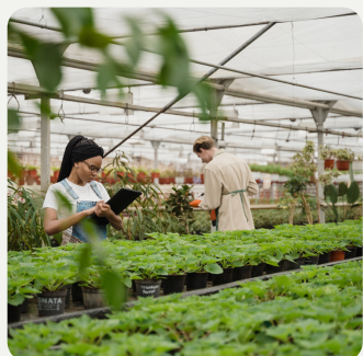
Pépiniériste & Espaces verts