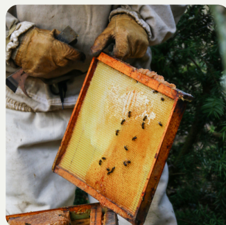
Faune Rûcher & Ferme