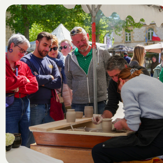
Poterie Atelier créatif