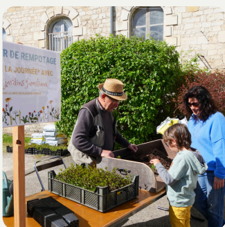
Animation & Prévention Jardin familiaux & Syded