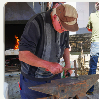
Ferronnier Exposition & démonstration