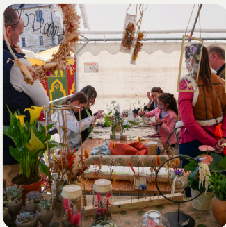
Artisan Fleuriste Atelier de composition