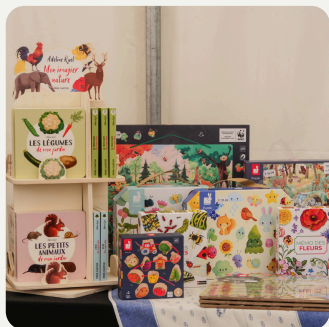
Libraires & Bibliothèque Vente & Lecture