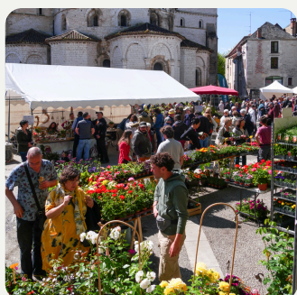
Pépinériste & Espaces verts