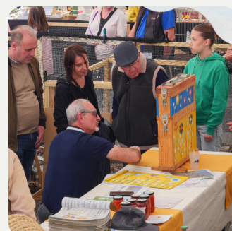
Faune Rûcher & Ferme