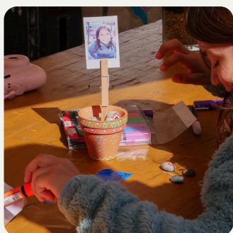
Animation enfants Maquillage et atelier avec le centre de loisirs